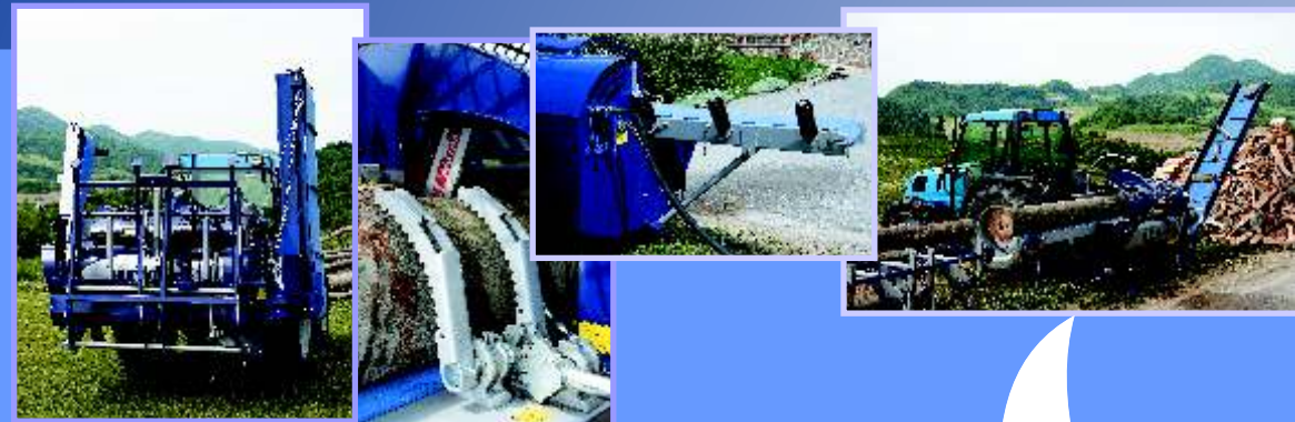
Транспортное положение процессора

Подающая лента и транспортировочный конвейер прикрепляются к процессору, последний в свою очередь прикрепляется на трактор посредством трех соединительных точек. Процесс подсоединения складного подъемника также быстрый и не сложный.