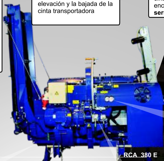
RCA 380 E

Un cilindro de rajar con la fuerza de rajado de 150 kN