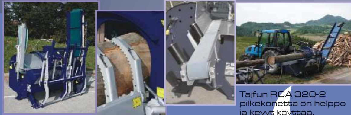
Tajfun RCA 320-2 pilkekoneetta on helppo ja kevyt käyttää.

Klapin pituus: 25-50 cm Max. paksuus: 10-32 cm Terälaippa: Oregon 16" Ketju: 3/8" Oregon MULTICUT Halkaisuteho: 2x100 kN Mitat: 610 cm x 307 cm x 130 cm Mitat: 239 [*236] x 235 [*221] x 130 cm Paino: 900 kg +130 kg