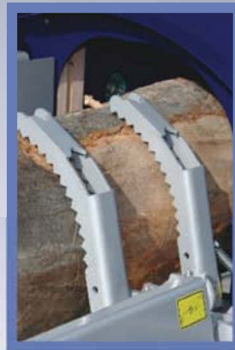
Durch den Niederhalter (Druckhebel) wird das Drehen des Holzes verhindert und der Stamm kann in einer sicheren Lage gehalten werden, so dass auch das letzte Stück des Stammes richtig in den Spaltkanal fällt.