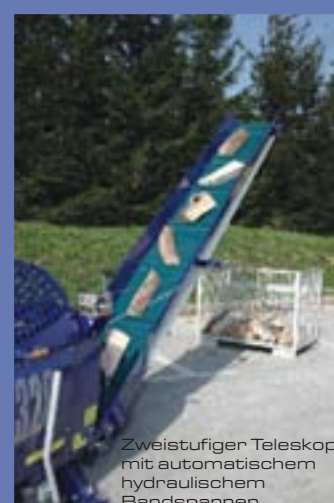
Zweistufiger Teleskop mit automatischem hydraulischem Bandspannen.

Zwei groß dimensionierte Zylinder (2x100kN-10t) schieben das Holz durch das Spaltnesser oder das Kreuz.