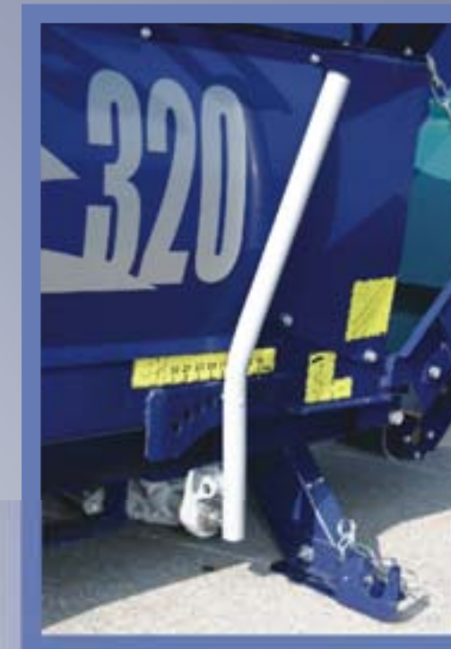
Die Höhe des Spaltnessers kann durch einen einfachen Hebel schnell und problemlos verstellt werden.