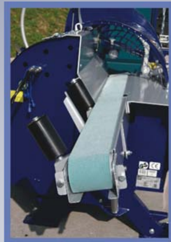
Das klappbare Vorschubband (2m) ermöglicht mühelos den Vorschub von langem und schwerem Holz.

Das Förderband mit einer Länge von 4 m ist serienmäßig im Lieferumfang dabei und Geschwindigkeit ist stufenlos einstellbar.