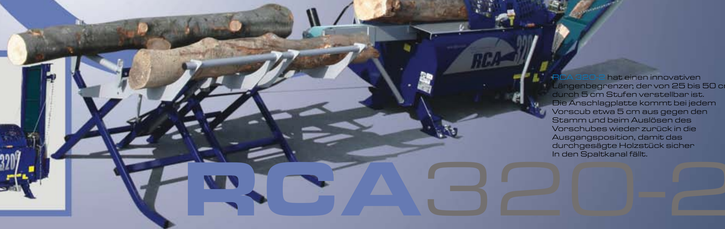
RCA 320-2 hat einen innovativen Längenbegrenzer, der von 25 bis 50 cm durch 5 cm Stufen verstellbar ist. Die Anschlagplatte kommt bei jedem Vorschub etwa 5 cm aus gegen den Stamm und beim Auslösen des Vorschubes wieder zurück in die Ausgangsposition, damit das durchgesägte Holzstück sicher in den Spaltkanal fällt.