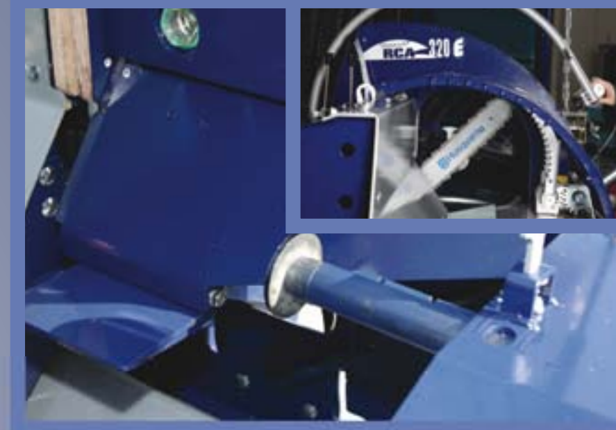
Die Kettensäge ermöglicht ein sicheres und schnelles Schneiden des Holzes, sowie eine einfache und problemlose Wartung.